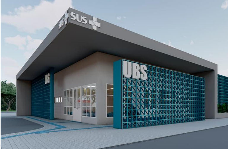
Unidade Básica de Saúde