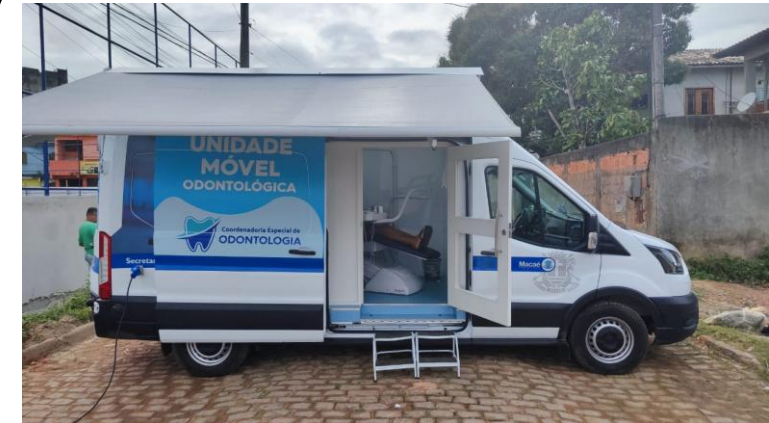
Unidade Odontológica Móvel