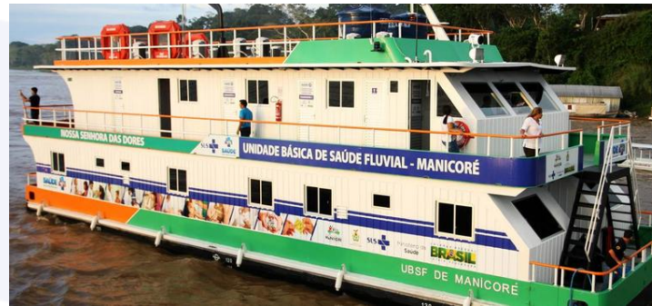
Unidade Básica de Saúde Fluvial